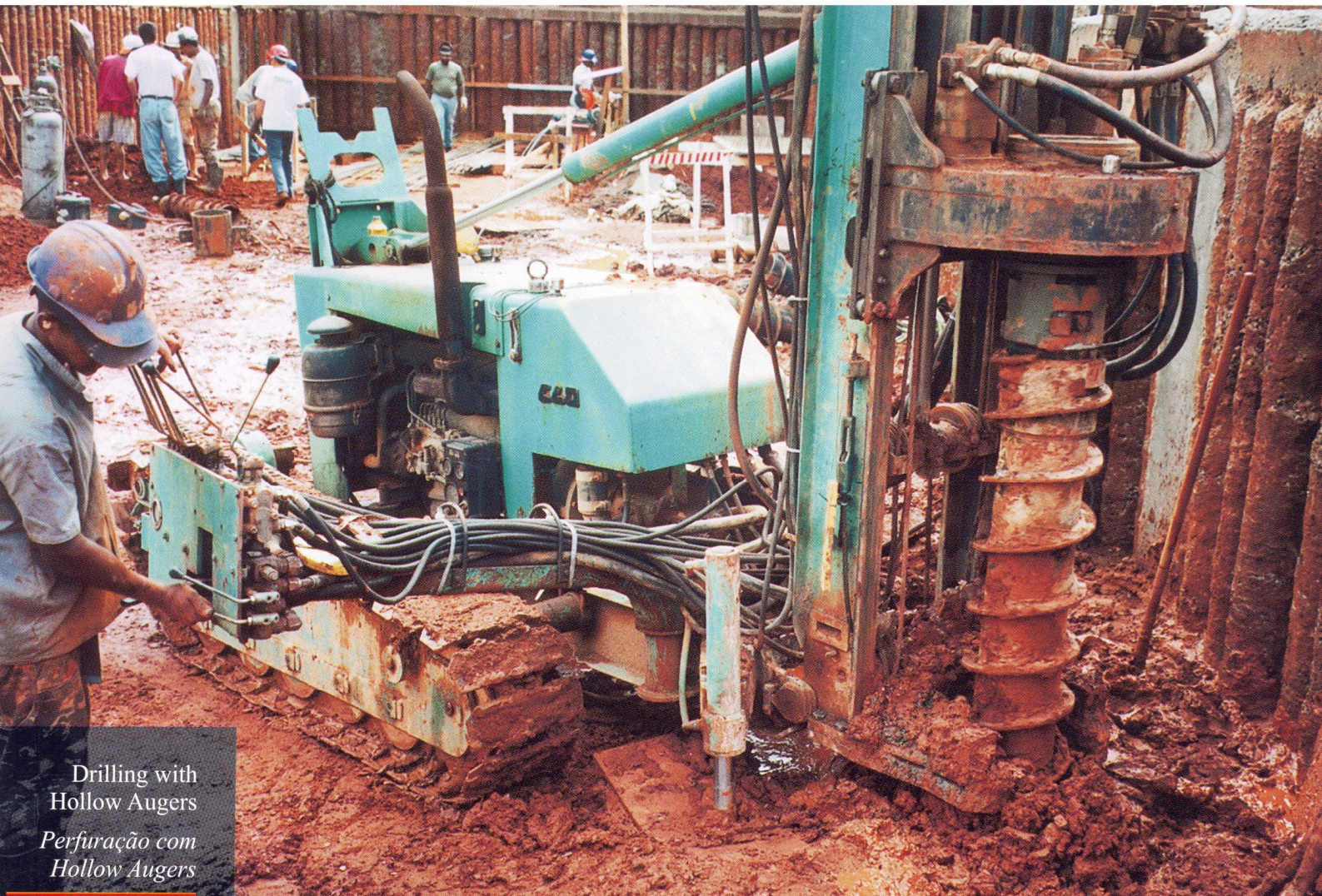
Drilling with Hollow Augers Perfuração com Hollow Augers