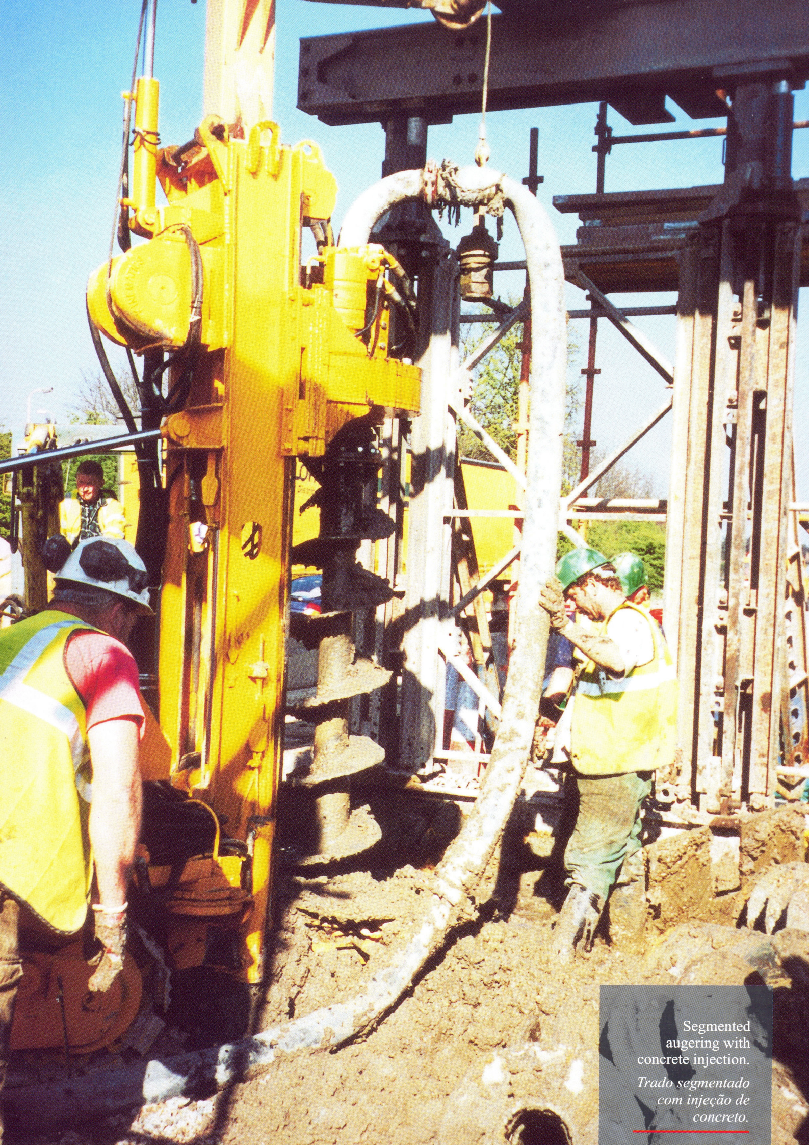
Segmented augering with concrete injection. Trado segmentado com injeção de concreto.