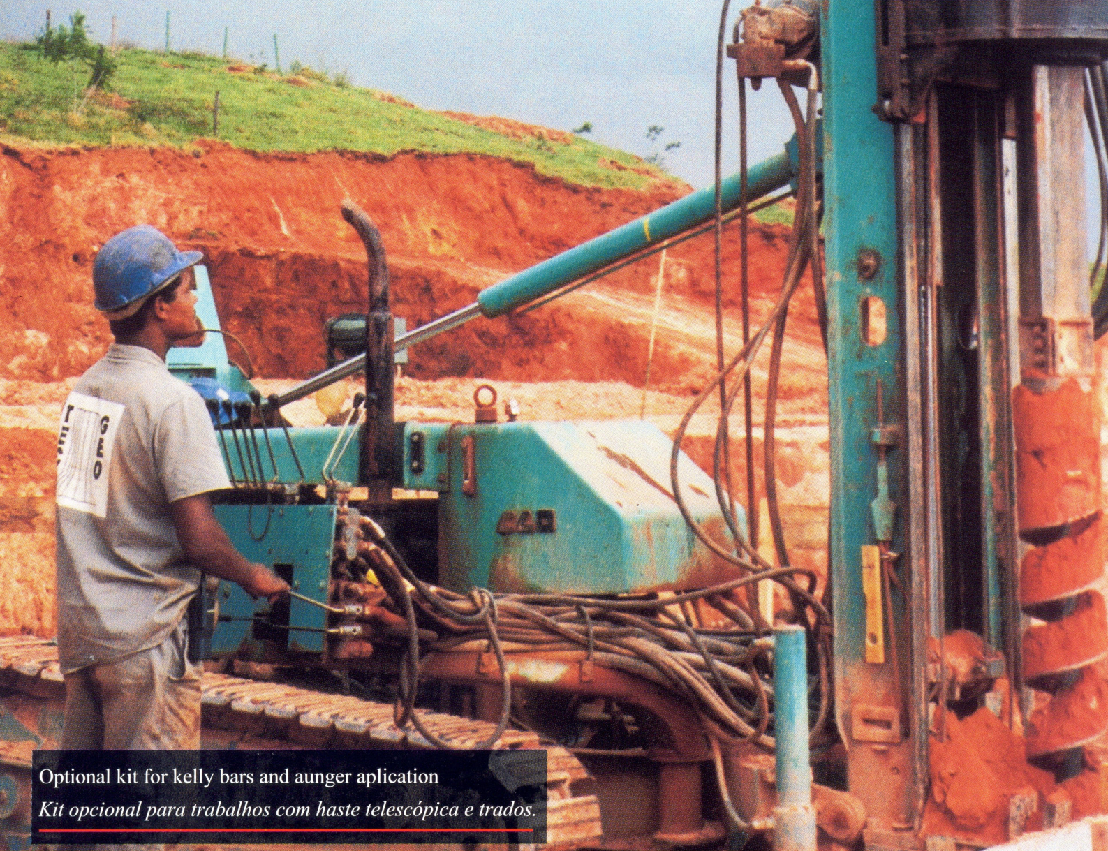
Optional kit for kelly bars and auger application Kit opcional para trabalhos com haste telescópica e trados.