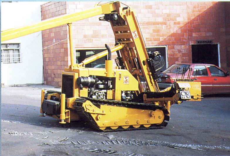
Front and rear jacks / Patolas anteriores e posteriores