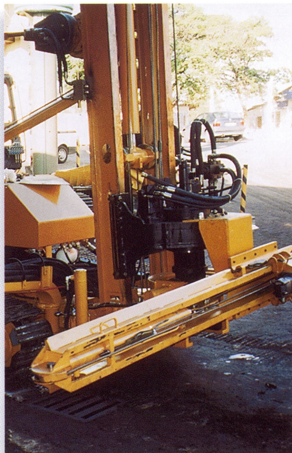
CR 04 optional kit for transversal drilling. Kit opcional de CR 04 para perfuração transversal.