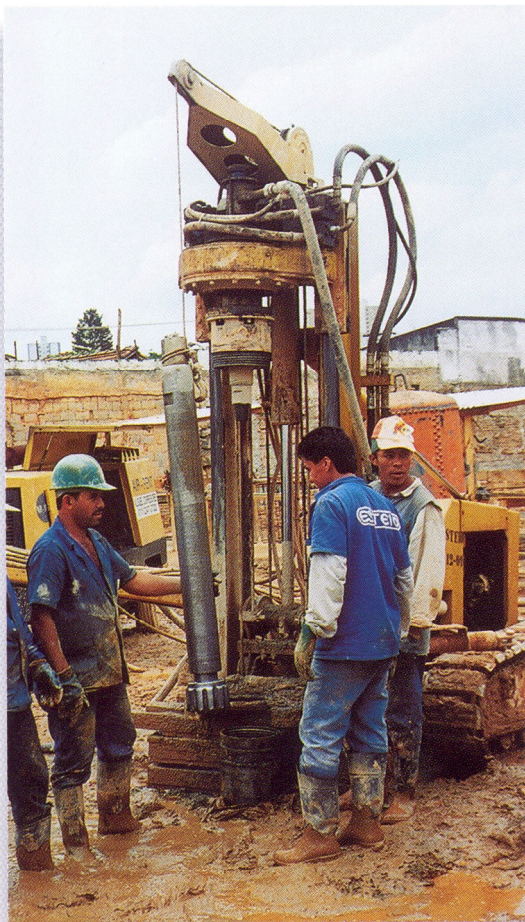
It drills up to 12 in Ø with DTH. Perfura até Ø 12 in com martelo de fundo de furo.