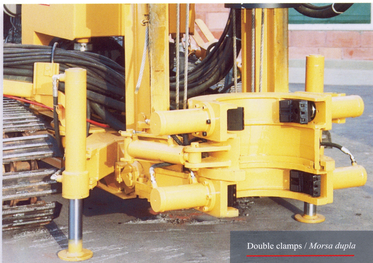
Double clamps / Morsa dupla